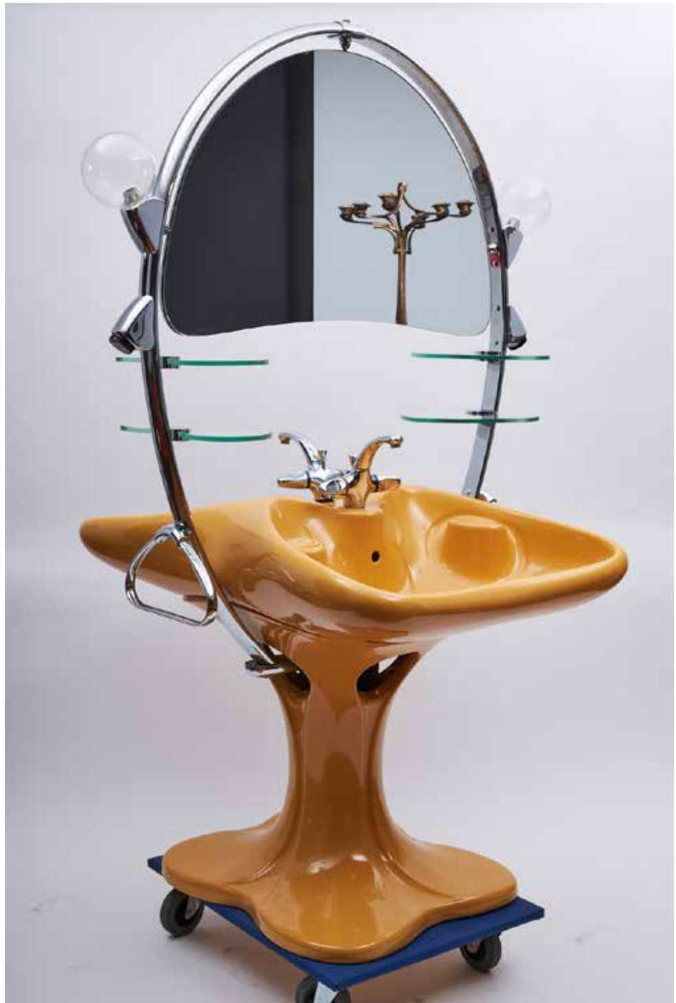
Luigi Colani Villeroy & Boch Doppelwaschbecken mit Spiegel in Currygelb 1979 Sammlung POPDOM Foto: Colya Zucker © Colani Design Germany GmbH