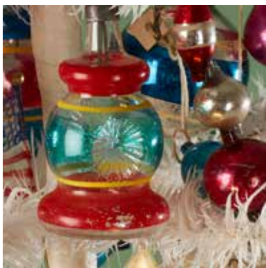
Décoration de Noël en verre États-Unis, à l'époque de la Deuxième Guerre Mondiale

Cette année, notre petite exposition temporaire se penche sur les décorations de Noël fabriquées à l'époque des deux guerres mondiales. Noël en temps de guerre avait une signification particulière. La plupart des pères de famille et des fils étaient au front. Ainsi, on envoyait au front des sapins de Noël dans des boîtes d'allumettes et à la maison, le message de paix chrétien était radicalement changé.