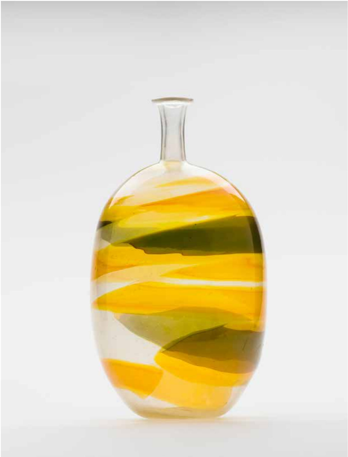
Carlo Scarpa, Pennellate, Entwurf 1942, Produktion 1960–1979