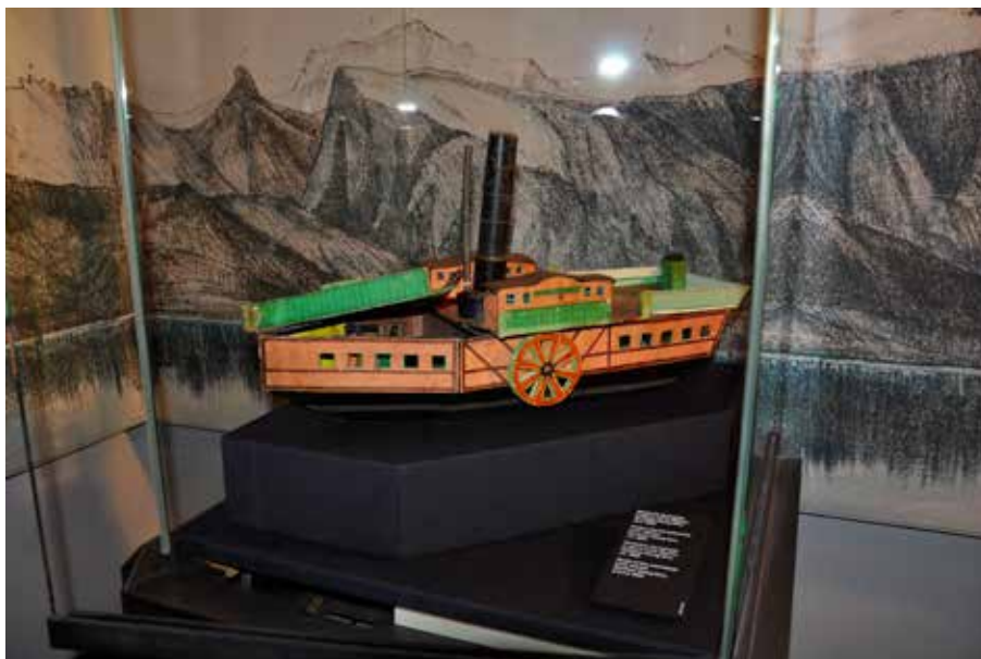
Maquette du bateau à vapeur Linth-Escher, vers 1850 (LM 59264)

Le Château de Prangins a dépoussiéré son sous-sol et présente désormais une toute nouvelle exposition pour les familles sous la forme d'un jeu de rôle avec, comme thématiques, le voyage en Suisse et les moyens de transport du 18 e au 20 e siècle. C'est une opportunité inédite pour le public de se plonger dans la Suisse d'antan et de faire un voyage à travers des paysages très différents.