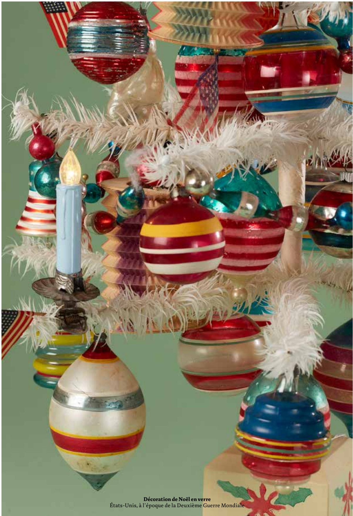
Décoration de Noël en verre États-Unis, à l'époque de la Deuxième Guerre Mondiale