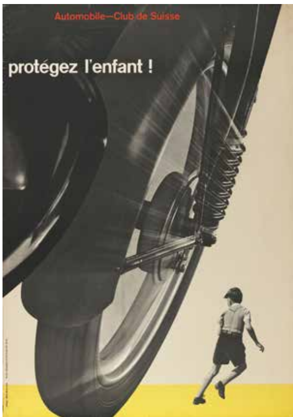
Josef Müller-Brockmann, Protégez l'enfant, 1953 © Museum für Gestaltung Zürich, Plakatsammlung, ZHdK

Im Rahmen der Reihe MyCollection erhält der Tessiner Grafiker Bruno Monguzzi eine Carte blanche, um seine ganz persönliche Auswahl an Objekten aus den bedeutenden Sammlungen des Museum für Gestaltung Zürich zu präsentieren.