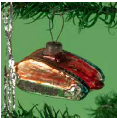
Tank, verre peint Vers 1940, Allemagne Prêteur: Alfred Dünneberger